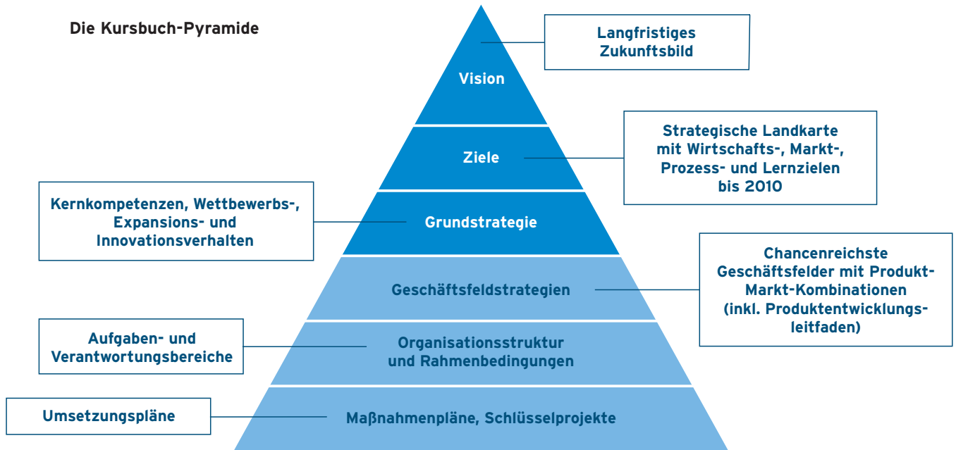
Abbildung 1 – Strategiepyramide Tourismus Niederösterreich

In diesem Teil sind konkrete Maßnahmen sowie Leitlinien für den Umgang mit Themen definiert.